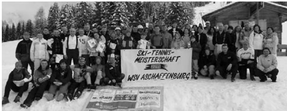
Alle Teilnehmer der Ski-Vereinsmeisterschaften 2011 und des 9. Aschaffener Ski-Tennis-Cups.

Beim WSV wurde der 9. offene Aschaffener Ski-Tennis-Cup am letzten April-Wochenende mit dem Tennisturnier beendet. Nach dem am 19. März in Hochkrimmel-Gerlos (Tirol) ausgetragenen Skirennen griffen nun die 21 Teilnehmer zum Racket und ermittelten auf der WSV-Anlage am Schönbusch ihre neuen Kombinationsmeister. Die beste Laufzeit aus zwei Riesenslalom-Durchgängen sowie die Platzierung im Tennisturnier wurden in Punkte umgerechnet und zum Gesamtergebnis addiert.