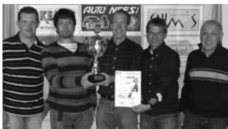
Die strahlenden Gewinner der Team-Wertung.